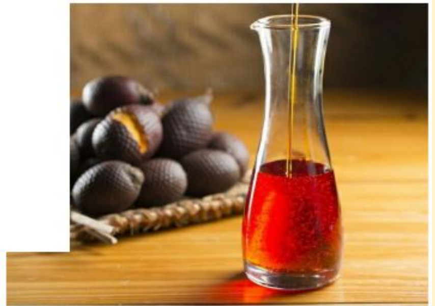
Óleo de buriti