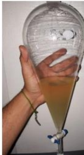
Essência de pau-rosa